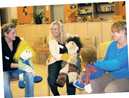
Veranstaltung in der Geriatrischen Tagesstätte: Einsatz von speziellen Handpuppen in der Betreuung von Demenzkranken.

Mittlerweile zum dritten Male stellte sich das Netzwerk Demenz im Landkreis Mayen-Koblenz vom 21. September bis 8. Oktober im Rahmen der »Wochen der Demenz« mit seinem vielfältigen Leistungsangebot nicht nur für Demenzkranke vor. Als Mitglied des Netzwerkes war auch die Rhein-Mosel-Fachklinik Andernach mit ihrer Geriatrischen Tagesstätte in der Kastanienallee in Andernach aktiv